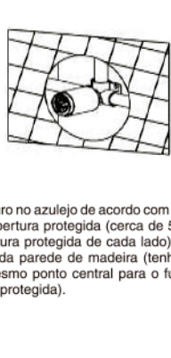
3. Faça um furo no azulejo de acordo com o tamanho e a forma da cobertura protegida (cerca de 5mm maior do que a cobertura protegida de cada lado). E, coloque o azulejo fora da parede de madeira (tenha atenção de manter o mesmo ponto central para o furo do azulejo com a tampa protegida).