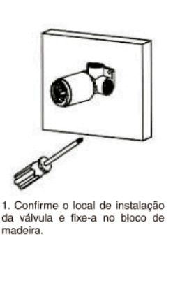
1. Confirme o local de instalação da válvula e fixe-a no bloco de madeira.

GUARDE A NOTA FISCAL E ESTE CERTIFICADO DE GARANTIA.