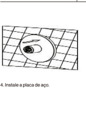
4. Instale a placa de aço.